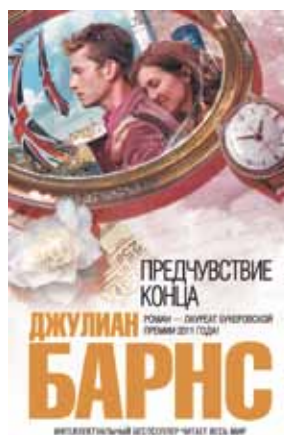
«Предчувствие конца», Джулиан Барнс

Книга «Восьмерка» – новый сборник повестей однозначно популярного Захара Прилепина. В сборник входят восемь небольших историй, не связанных общим сюжетом или перекрестными персонажами. Все они происходят в 90-е годы и имеют ошутимый автобиографический бэкграунд; как пояснял сам Прилепин, описываемые события происходили либо с ним, либо на его глазах. Детство в глухой подмосковной деревне на три избы, работа в провинциальном ОМОНе, будни приятеля-угасающей рок-звезды, сцены милицкого беспредела – все это в удручающей атмосфере страны под царствованием «пьяного и дурного государя». Читателя по-прежнему ждет насилие, абсурд, коррупция, грязь и нищета, но Прилепину все также удается «попасть в самое яблочко» русского смысла жизни, если он, конечно, вообще существует.